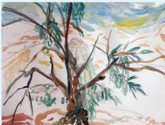
מצאנו מים, 2011, צבע מים על נייר, 76x57