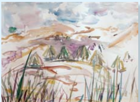
עין קרא, 2011, צבע מים על נייר, 76x57