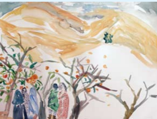
כשנמות לא יקברו אותנו, 2011, צבע מים על נייר, 76x57