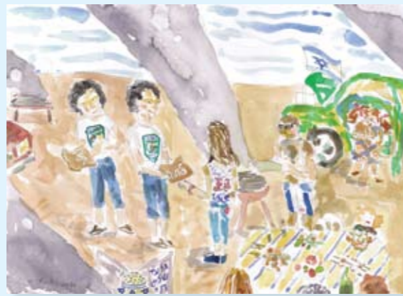
לתת 1, מתווה למיצג, צבע מים על נייר, 36x26