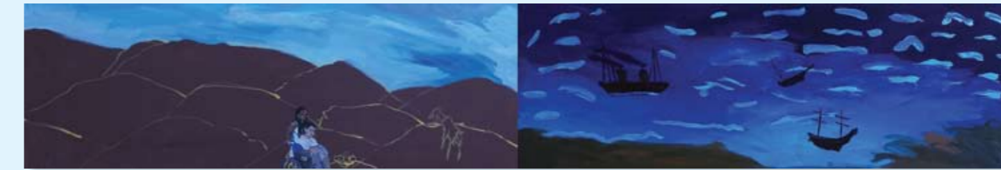
המתפלת, 2011, דיפטיך, שמן על בד, 240x40