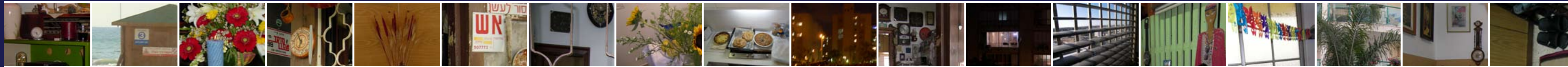
09 שרשרת העצמאות, 2011, הדפסות צבע על נייר צילום, כל הדפסה בגודל 68x50