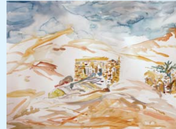
חורשת האקליפטוס, 2011, צבע מים על נייר, 76x57