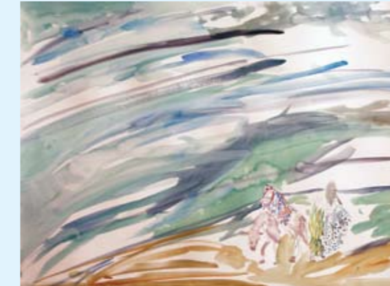
בביתנו במדבר, 2011, צבע מים, 76x57