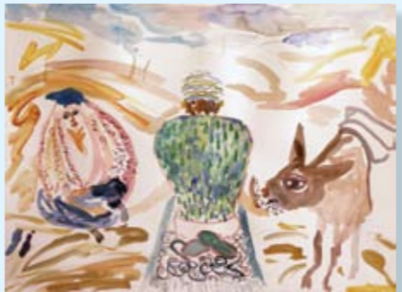
צהריים טובים, 2011, צבע מים על נייר, 76x57