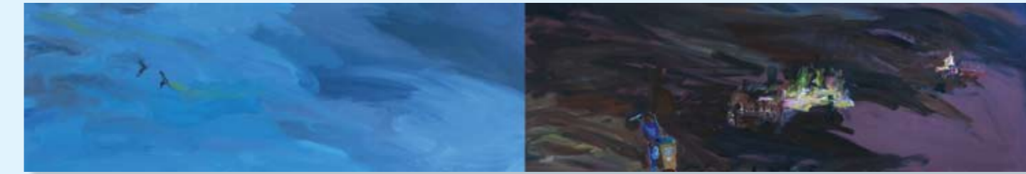
מנקה החוף, 2011, דיפטיך, שמן על בד, 240x40