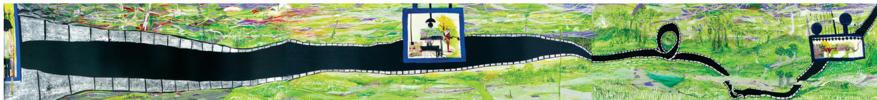
ללא כותרת, אקריליק וקולאז' על מזוויט 0.80/7.20 מ', 2007