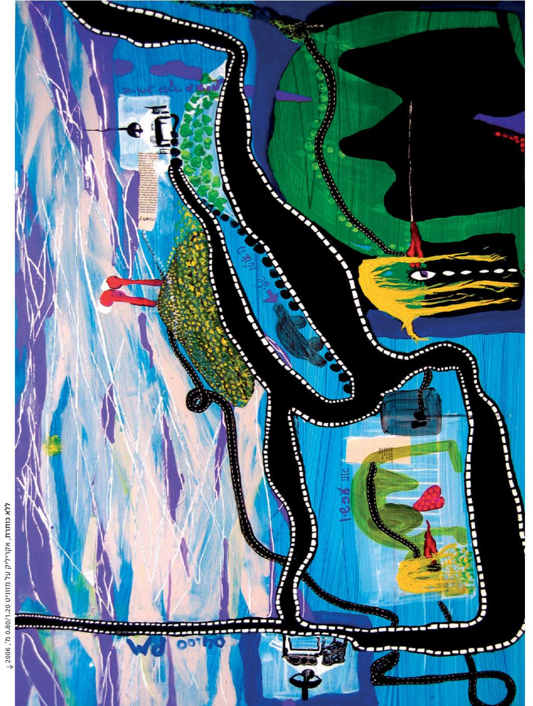
ללא כותרת, אקריליק על מונוים 1.20/0.80 מ', 2006