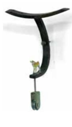
סיפור ילדים, 2002, 18/22 ס"מ, עומק 5 ס"מ

(3) מיכאלאנג'לו, 'יום הדין האחרון' 1541-1534. החוקרים מניחים שהפנים המצוירות בעור המקורקף הם של האמן עצמו.