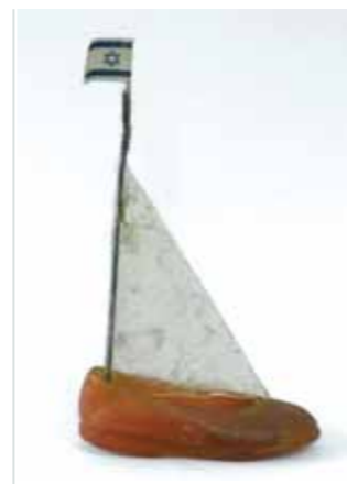
נעל סירה, 2002, יציקת פוליאיסטר, 10/22/6 ס"מ