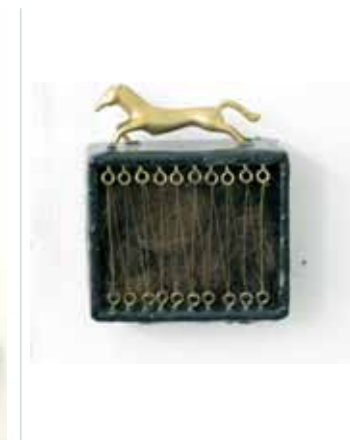
שאלה של תנועה, 2006, עץ, מתכת, שיער, 10/6 ס"מ, עומק 5 ס"מ

(1) מורג התגוררה בילדותה בשכונת לאדית סמואל, אמנית תושבת העיר ראשל"צ.