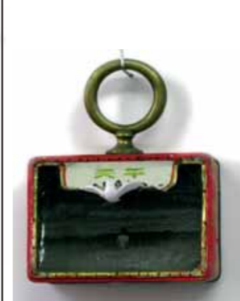
שאלה של איזון, 2006, גודל 15/10 ס"מ, עומק 5 ס"מ

יצירת הגופים הפיסוליים מזכירה פעולה של יצירת תכריכים. קיפולי בד לבן שעטפו את גופה של