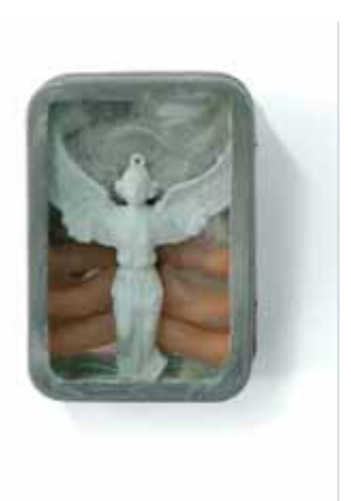
מרשמלו, 2003, גודל 10/6 ס"מ, עומק 5 ס"מ