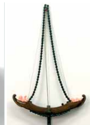
ארץ לעולם לא, 2004, עץ, פלסטיק, שרשרת אופניים, 50/30 ס"מ, עומק 5 ס"מ