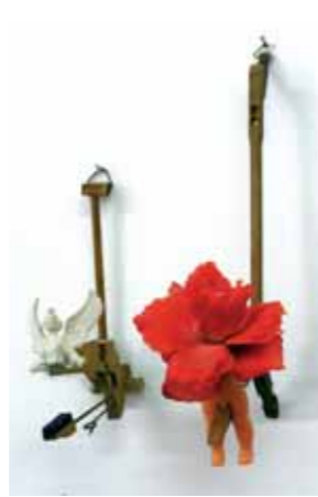
פיית הפרח, 2004, חלק של פסנתר, בובה, פרח, 6/18 ס"מ, עומק 7 ס"מ מלאך הפסנתר, 2002, גודל 5/10/5 ס"מ

(6) הגלריה העירונית לאמנות שימשה כבית 'מגן דוד אדום' וזיכרון ילדות אצל מורג, של אחות הלבושה בגד לבן מעלה קשר אפשרי נוסף אל העבודות הלבנות.