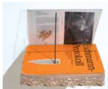
מדף הספרים שלי, 2006, 23/28 ס"מ, עומק 17 ס"מ